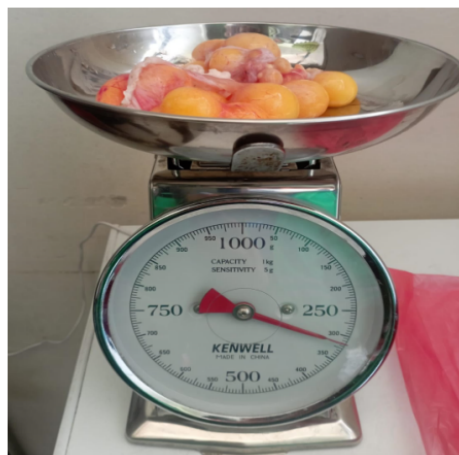
Fotografías 2 y 3. Verificación de productos de tortuga morrocoy ( Chelonoidis carbonarius ) incautados. Acta Única de Control al tráfico ilegal de flora y fauna silvestre No. 161687.